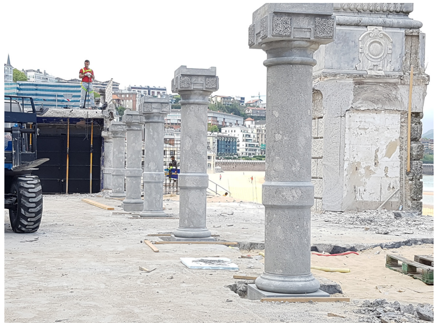
Estado previo a la intervención

Recuperación del estado original del voladizo de la concha. Para ello se han sustituido los pilares de hormigón de la estructura del voladizo por columnas de piedra caliza y arcos de hormigón iguales a las existentes en origen. Dicha intervención estaba englobada en las obras de renovación de la estructura del voladizo de la concha