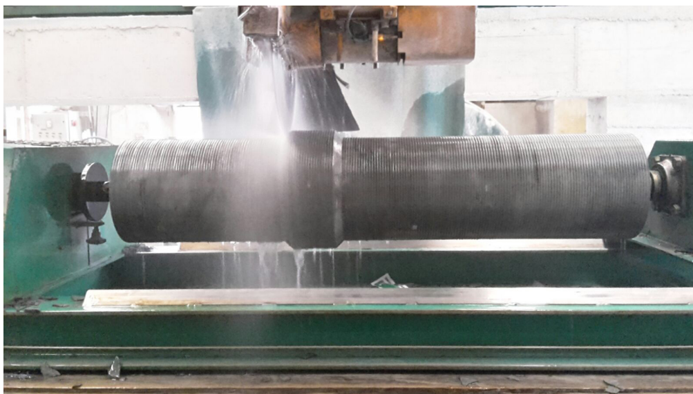
Torneado de la columna de caliza