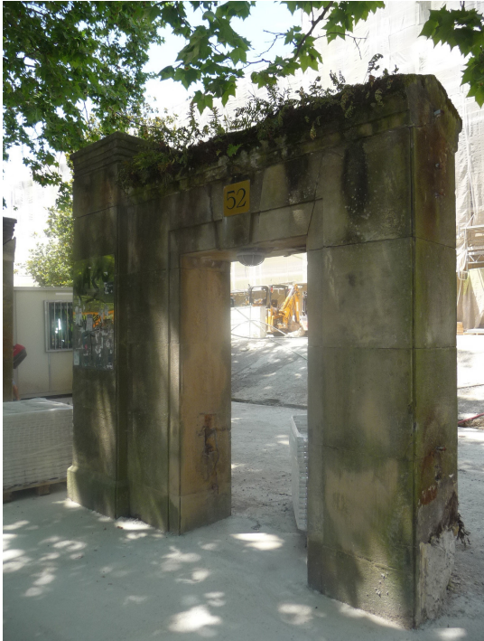
Estado previo a la intervención

Limpieza y restauración de elementos de piedra arenisca en la entrada antigua a la Tabakalera. Puntualmente se colocó piedra nueva. Finalmente se aplicó un tratamiento hidrófugo.