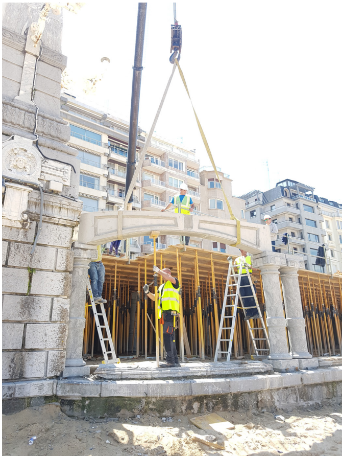
Colocación del arco de hormigón armado moldurado, sobre columnas de piedra caliza, para configurar el frente del voladizo de la Concha.