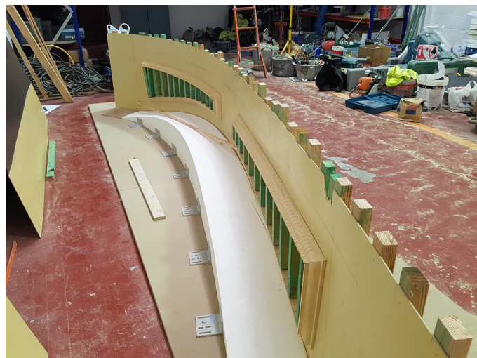
Reproducción de arco curvo de hormigón, tal y como era en su estado original.