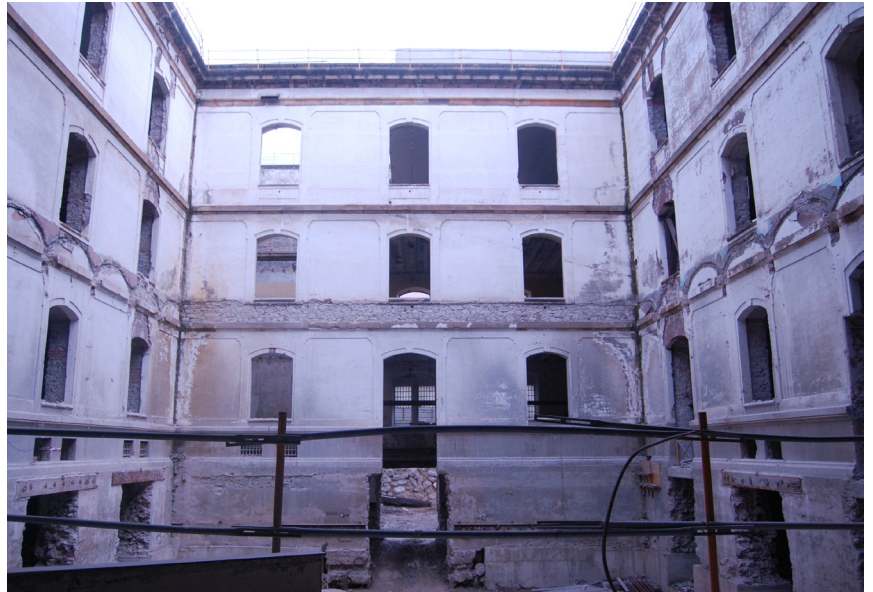
Estado previo a la intervención

Limpieza y restauración de elementos de piedra en patios y salas del edificio, mediante reposición con piedra nueva y con morteros de reparación especiales. Entre las diversas operaciones, se han restaurado los alfeizares y se han repuesto los pasos de puerta con piedra nueva.