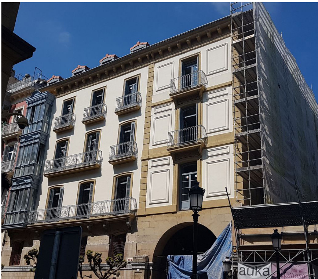
Estado previo a la intervención

Rehabilitación integral de fachada en la plaza Gipuzkoa. Entre los trabajos se realizaron: La restauración de molduras y elementos perdidos de fachada de piedra arenisca, recuperación de volúmenes en paramentos verticales de piedra de sillería a base de aplicación de morteros de reparación y resinas. Colocación de aplacado de piedra arenisca, Limpieza de paramentos con microabrasión, picado manual de morteros hasta llegar al soporte del muro. Lucido de paramentos y revestimiento de fachada.